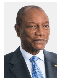
S.E. Prof. Alpha Condé Président de la République de Guinée, Coordinateur de l'UA pour les énergies renouvelables et Président du Conseil d'administration de l'AREI

"Through the support and guidance of AREI, African countries are set to ensure universal access to people-centred energy for all their communities and move straight to renewable energy systems and zero carbon futures."