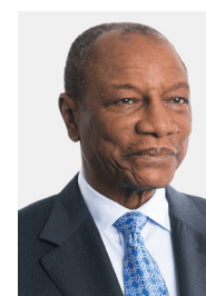
S.E. Prof. Alpha Condé Président de la République de Guinée, Coordinateur de l'UA pour les énergies renouvelables et Président du Conseil de d'administration de l'AREI

"Grâce au soutien et aux conseils de l'AREI, les pays africains doivent assurer un accès universel à l'énergie pour le bien-être de tous les citoyens et communautés en adoptant directement des systèmes d'énergie renouvelable et sobre en carbone dans le futur."